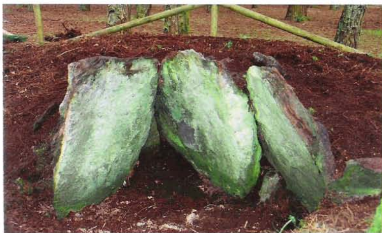
Dolmen en la Sierra de Penouta

El concejo de Boal posee un rico y variado patrimonio arqueológico. Sobre las suaves y amplias líneas de cumbres que flanquean el curso del río Navia se extienden decenas de monumentos funerarios levantados hace unos 6.000 años por los primeros colonizadores del valle. Dólmenes construidos para albergar los difuntos de aquellas primitivas comunidades neolíticas sobre los caminos de montaña que, desde la costa hasta las tierras altas interiores, recorrían estacionalmente hombres y rebaños y con cuya elemental pero contundente arquitectura se reivindicaba ante cualquier intruso la prevalencia territorial.