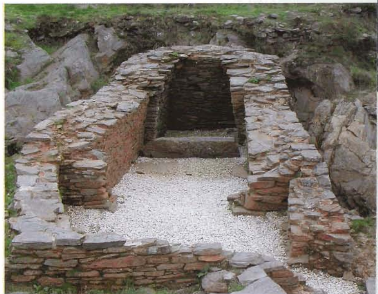
Sauna de la Edad del Hierro. Autor: Ángel Villa Valdés.

Más información sobre El Castro de Pendia en www.castrosdeasturias.es