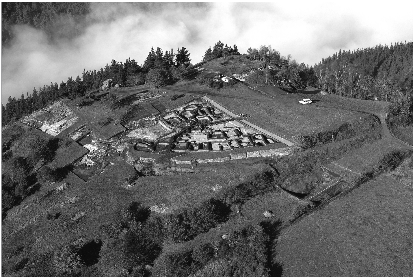
Fig. 126. Fotografía aérea de Chao Samartín (Grandas de Salime)

Ochoa y Morillo 2002a: 907-909). Esta nueva reestructuración administrativa también tuvo su reflejo en la organización del ejército y en la potenciación de ciertas funciones desarrolladas por los militares. Se emprende entonces la explotación masiva de los nuevos territorios dominados al norte de la Cordillera Cantábrica y es a partir de este momento, finales del gobierno de Augusto y durante el reinado de Tiberio, cuando empezamos a percibir las primeras evidencias de la presencia de Roma en Asturias 2 .