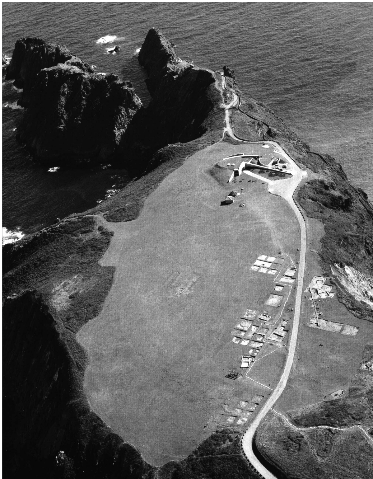
Fig. 125. Fotografía aérea de La Campa Torres (Gijón). De este yacimiento proceden los materiales romanos más antiguos de Asturias