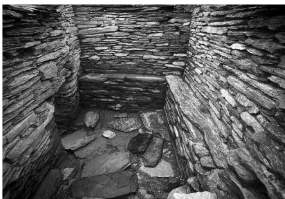
Fig. 3. Sauna del castro de Chao Samartín. Durante el siglo I se consuma la transformación de los monumentos prerromanos con su rudimentaria adaptación a gustos termales importados. En la imagen se muestra el antiguo tholos adaptado a modo de sudatio con bancos dispuestos ante la boca del horno.

estancias, desplazamiento de la fuente de calor y algunos añadidos funcionales.